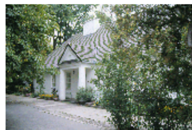
Żelazowa Wola - casa natale di Chopin